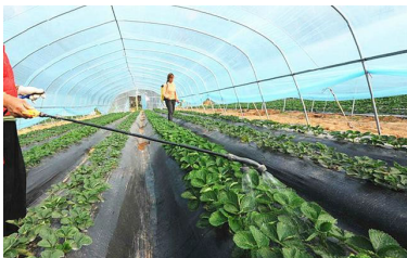
葉面施肥可減少50%肥料施用量