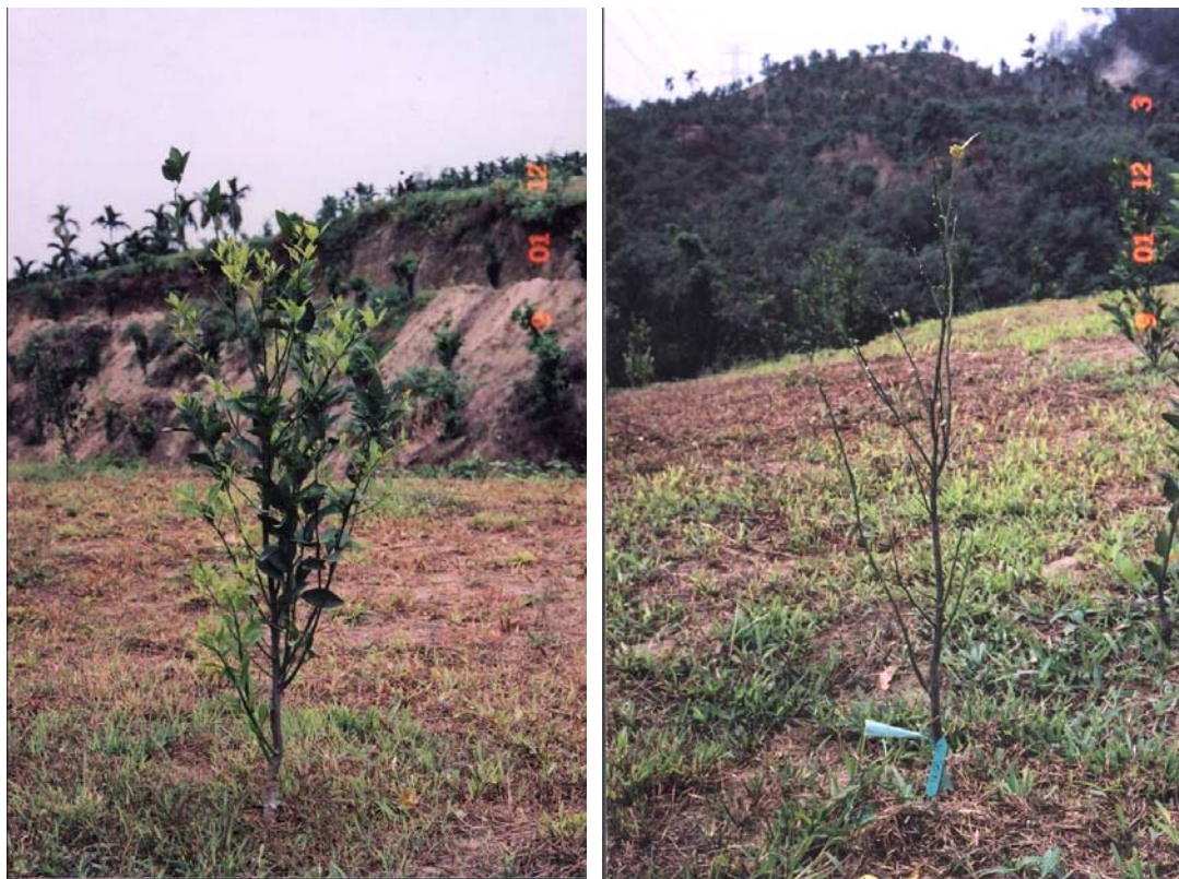
圖一、SGS3醱酵製劑於嘉義大林地區田間對柑橘裾腐病之防治效果，左圖為經澆灌處理之植株恢復生長之情形，右圖則為未處理之對照植株。

Fig. 1. Control of foot rot infection of field grown sweet orange at Da-Lin Chia-Yu by soil drenching with the 100X diluted Streptomyces griseobruenneous S3 broth culture. The photo on the left shows the revived growth after treatment comparing to that of the none treated control plant showing on the eight.