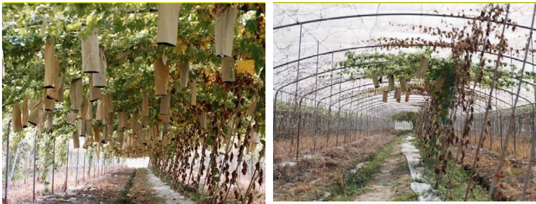
圖二、SGS3醱酵製劑於屏東萬丹地區田間對苦瓜連作障礙之防治效果，上圖示為著果後田間植株存活率調查結果處理組(BS+S)與對照組(CK)比較；下左圖為經澆灌處理之植株旺盛生長之情形，下右圖則為未處理之對照植株。